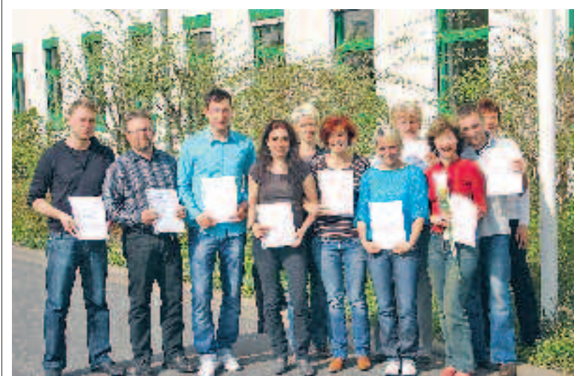
Super Jahrgang: Elf der insgesamt 13 erfolgreichen Absolventen der Fortbildungsprüfung zum/zur „Betriebswirt/-in (HWK)“ nach dem Erhalt ihrer Prüfungszeugnisse in Rudolstadt.

Erfolgreicher Abschluss für 13 Betriebswirte des Handwerks