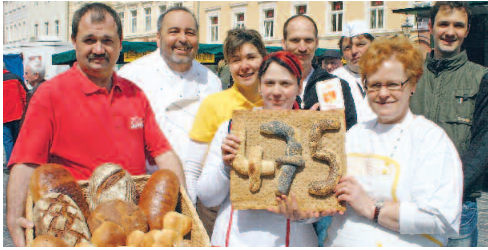
Freude bei den acht am Altenburger Brotmarkt teilnehmenden Bäckereien über den großen Kundenzuspruch . Die Aktion zum 475-jährigen Jubiläum der Innung fand großen Anklang und soll keine Eintagsfliege bleiben.